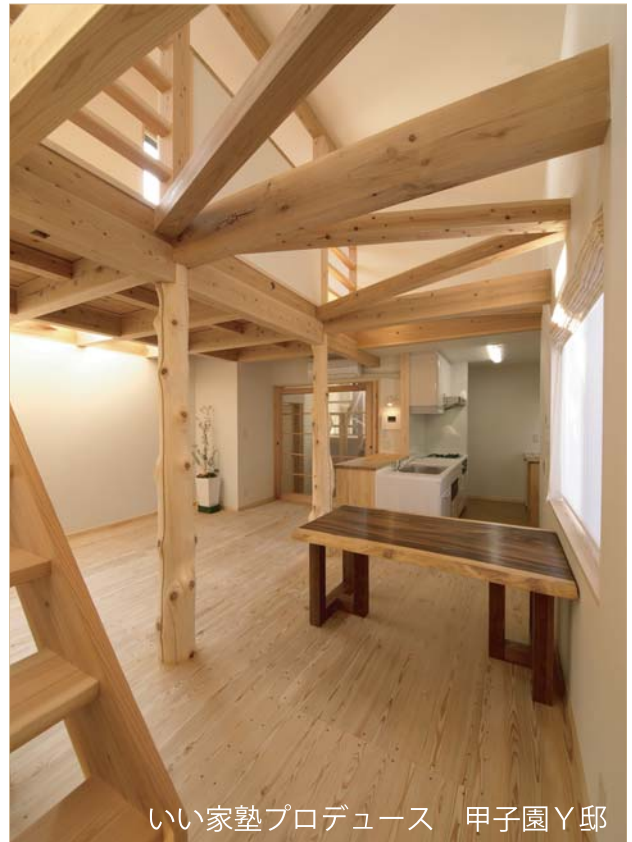
いい家塾プロデュース 甲子園Y邸